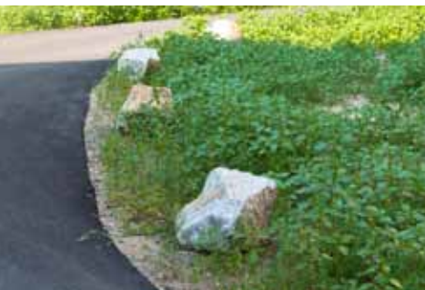
asphaltierte Straße mit Natursteineinfassung in der O.-Buchwitz-Straße

Mehrfamilienhauses Pestalozzistraße 1 a – d. Die Bernsdorfer Wohnungsgesellschaft hat die Außenhülle des Wohnblocks saniert und ihr einen frischen Anstrich verpasst.