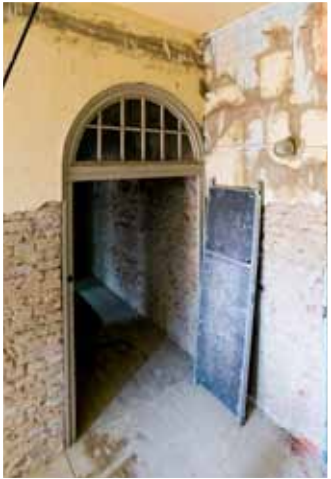
Altersgerechte Wohnungen entstehen in der E.-Thälmann-Straße 24 im Stadtzentrum.