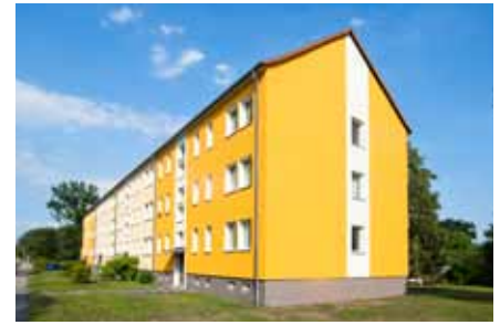
Die Fassade der Pestalozzistraße 1 a - d strahlt in frischen Farben.